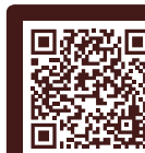
The Science Kid